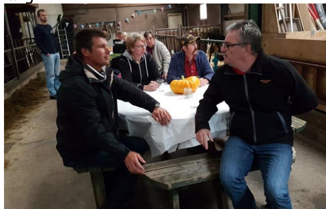
Foto: BBQ in stal

heerlijke barbecue! Het was gezellig om bij elkaar te zijn en met zo'n grote groep te mogen eten!