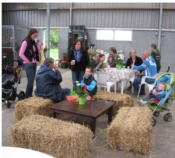
-genoeg belangstelling op de open dag-

OPEN DAG. Zaterdag 19 juni was het dan zo ver, de open dag. We kijken terug op een heel geslaagde dag. De foto's van deze dag en zelfs een film, hebben we geplaatst op www.picasaweb.com . Via de mail kunt u hiervoor een link ontvangen. Nieuwsgierig? Mail naar geeke@huiberthoeve.nl